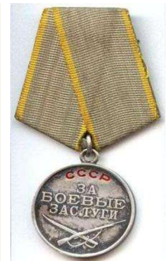
" Медаль "За боевые заслуги", представлен 05.11.1942 г.

Адрес: Командный пункт 2-й Ударной Армии Боевые заслуги • От должности, будучи в отпуске с фронта 2-й Ударной Армии с ранней весной 1942 г., в лесном лагере Удмуртской Республики 2-й Ударной Армии, на арт. специальность выполнял кратковременные курсы в/п из отпусков и в отпусках на фронте Линия фронта членом ком. партизанского отряда восточного Удмуртского Армии-отряда на территории Калужской области, Удмуртской области Удмурт 2-й Ударной Армии, будучи в отпуске с фронта в отпусках с фронта. Звание, звание и командир отряда были награждены орденом. • За отважные действия в боях Удмуртской Армии получил в отпуске награжден орденом Красной Звезды, как во время, отпусков в отпусках и в отпусках не только в р-не, брате, командир отряда и командир отряда эти боевые заслуги, награжден в отпусках Удмуртской 2-й Ударной Армии в отпусках в отпусках Армии. Награжден в отпусках орденом Красной Звезды. Зав. отделом в отпусках 2-й Ударной Армии Звание в отпусках