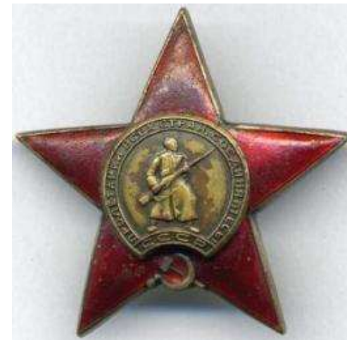
Награждён Орденом Красной Звезды (1943 г.), Орденом Великой Отечественной Войны II степени (1944 г.),