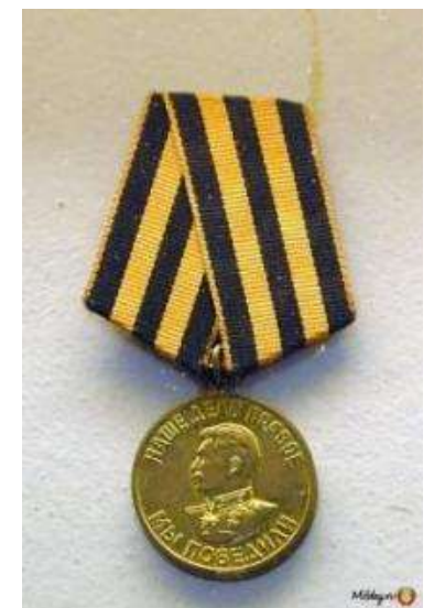
Медалью «за Победу над Германией» (1945 г.) [источник информации – «Подвиг народа»: ЦАМО Ф. .., Оп. 18002, Д....].